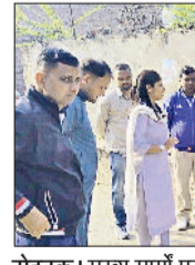
रोहतक। मुख्य मार्गों पर निरीक्षण करती संयुक्त आयुक्त।