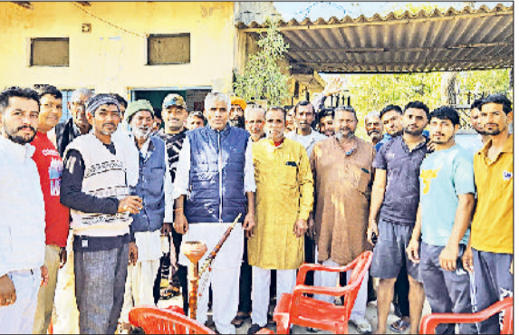
महम। अशोकनगर की किशनगढ़ पंचायत में मौजूद ग्रामीण और गांव के खाली प्लॉट बनी झुग्गियां जहां रोहिंय्या मुसलमान रहते हैं।

गांव के ही व्यक्ति ने किराए पर दिया प्लॉट, एक झुग्गी का किराया, एक हजार रुपये