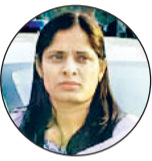
निगता कुमारी, संयुक्त आयुक्त, नगर निगम

फिलहाल 500 बंदरों का ही टेका दिया है, लेकिन साथ ही साथ अन्य जगहों से भी बंदरों को पकड़ा जाएगा। अभियान को इसके लिए परेशान नहीं होने दिया जाएगा। 500 के बाद अन्य बंदरों को भी पकड़कर जंगलों में छोड़ा जाएगा।